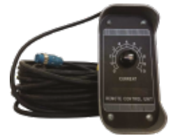
CONTROL REMOTO (OPCIONAL)