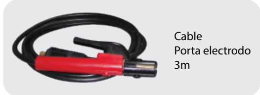
Cable Porta electrodo 3m