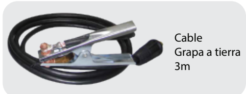
Cable Grapa a tierra 3m