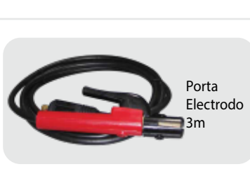
Porta Electrodo 3m