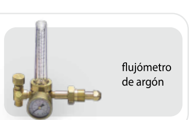
flujómetro de argón